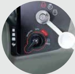
Dispositivo automático à TDF

Aceite trabalhos difíceis em espaços apertados com o T495. Este trator oferece a melhor tecnologia da nossa gama de compactos e utilitários, equilibrando potência adequada, manobrabilidade excepcional e comodidades operacionais.