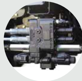
Predisposição para carregador frontal com joystick